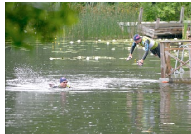
I tvåmannalag tog deltagarna sig runt Eksjö via sjöar och skog.